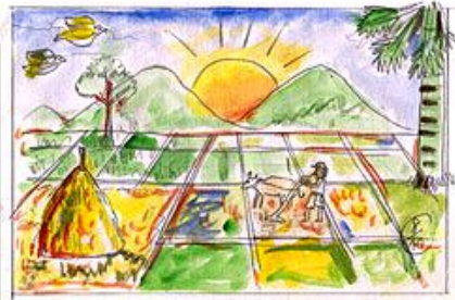
ถนนสายกิจกรรม